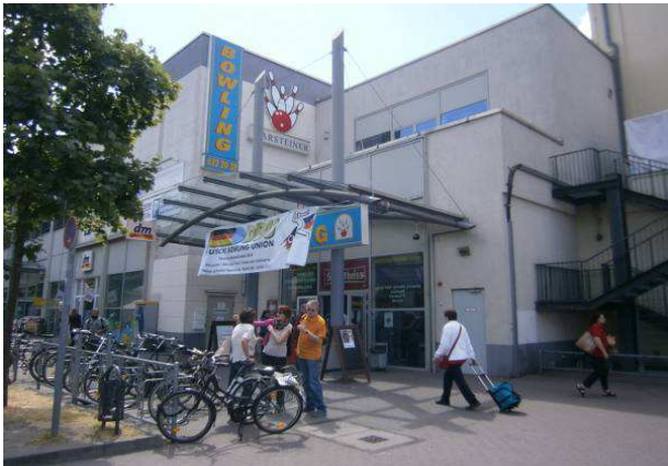
Neue City Bowling Hasenheide